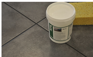
Rengøring med Syr á'

Afdækning af de færdigt fugede overflader må tidligst ske efter 1 - 2 døgn. Afdækningen må kun foretages med egnet afdækningspap og ikke plastfolie.