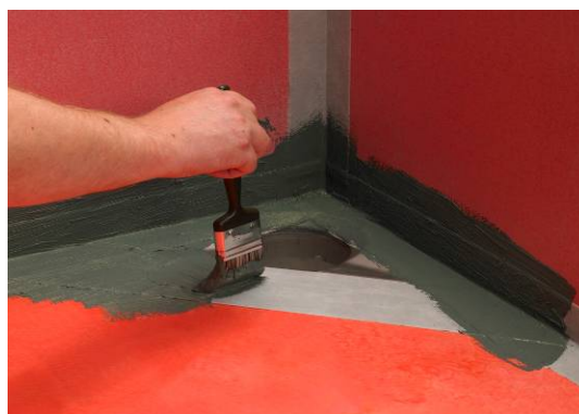
5. Påføring af Alfix Tætningsmasse

Bemærk: Alternativt kan der i overgang mellem gulv og afløb/sluk monteres Alfix Armeringsvæv i tætningsmassen.