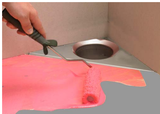
2. Primning af underlag.

Beton primes kun en gang med Alfix Primer fortyndet med vand 1:3.