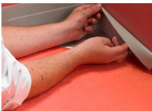
4. Montering af Seal-Strip

Montering af Alfix Seal-Strip sker ved først at fjerne halvdelen af beskyttelses-papiret og trykke fast og derefter tilsvarende med den anden halvdel.