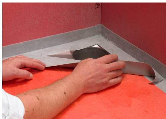
4a. Montering af Seal-Strip