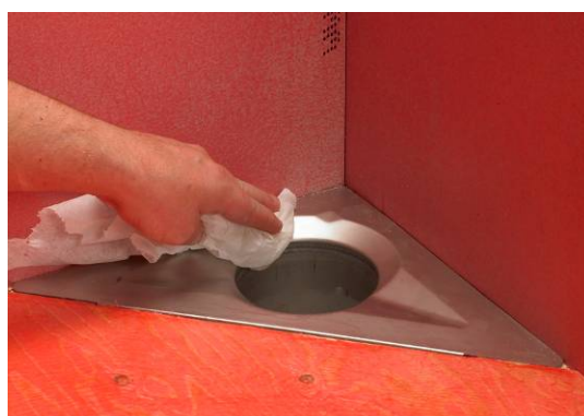
3. Rengør afløbets krave og affedt med f.eks. acetone.

For at sikre en god vedhæftning og dermed etablere en vandtæt samling ved gulv afløbet/slukken er det vigtigt at afløbets/slukens krave rengøres og affedtes.