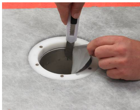
7. Skær hullet ud