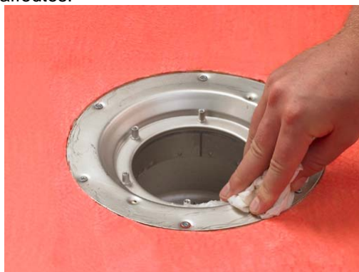
3. Rengør afløbets krave og affedt med f.eks. acetone.

For at sikre en god vedhæftning og dermed etablere en vandtæt samling ved gulv afløbet/slukken er det vigtigt at afløbets/slukens krave rengøres og affedtes.