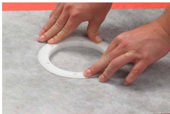
5. Markering af hullet