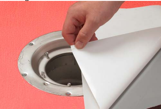
4. Montering af Afløbsmanchet

Alfix Afløbsmanchet lægges først løst over afløbsskålen. For at fastgøre manchetten fjernes beskyttelsespapiret fra bagsiden. For at opnå det bedste resultat, bør man kun fjerne papiret fra halvdelen af manchetten og trykke den fast, før resten af papiret fjernes og montering kan færdiggøres. Efterfølgende skæres hullet ud.