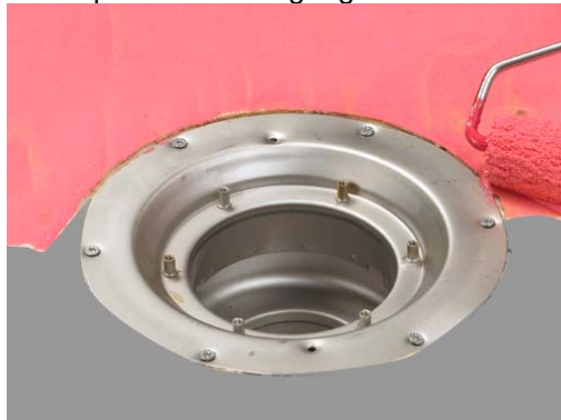
2. Primning af underlag.

Beton primes kun en gang med Alfix Primer fortyndet med vand 1:3.