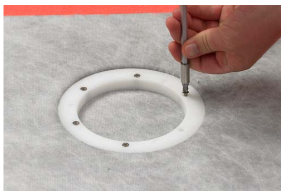
6. Montering af klemring. Bemærk: Krydspændes