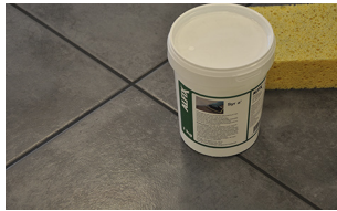
Rengjøring med Syr å

Tildekking av ferdig fuktete overflater må tidligst skje etter 1–2 døgn. Tildekking må kun foretas med egnet tildekkingspapp og ikke plastfolie.