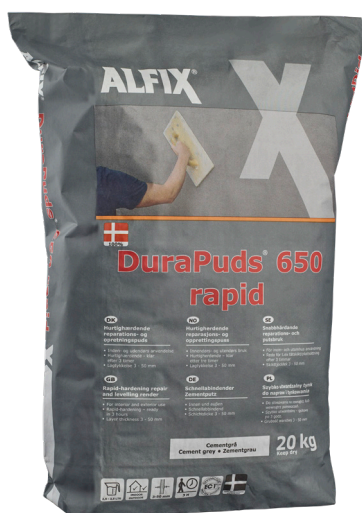
Alfix DuraPuds 650 rapid